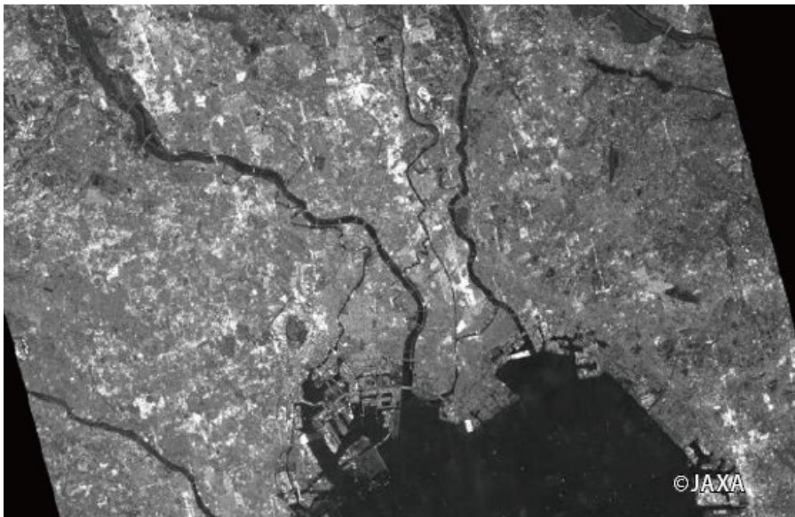
G 空間情報センターから検索が可能になるデータのの一つである PALSAR-2 の画像イメージ