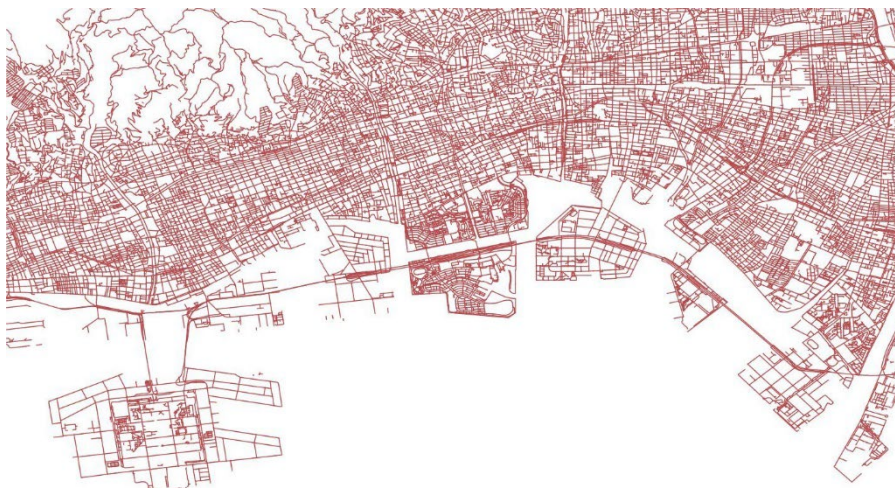
「地理院地図 Vector (仮称)」 (国土地理院) を加工して AIGID が作成